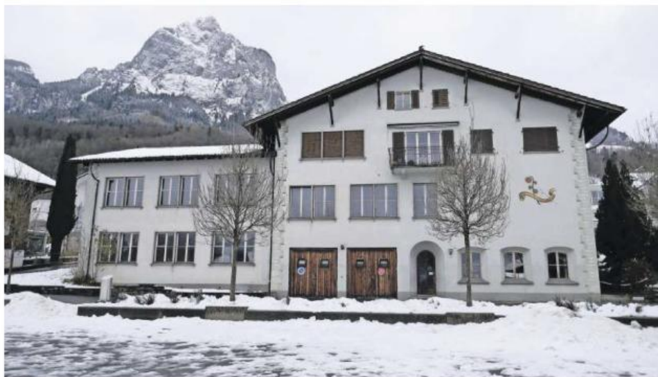
Das Schulhaus Höfli in Rickenbach wird nicht mehr benötigt und deshalb nächstes Jahr abgebrochen.

Außerdem für 2022 sind Investitionen von fast 20 Millionen Franken geplant: